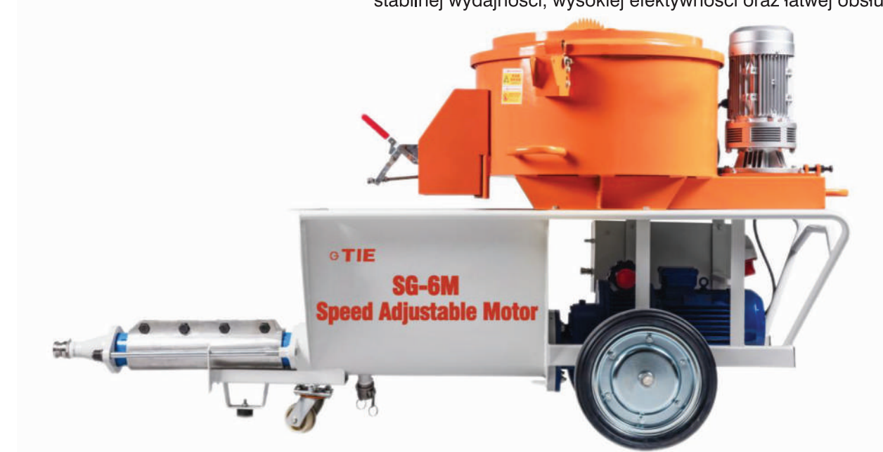
▲ SG-6M (Silnik z mechaniczną regulacją prędkości)

Warto posiadać tę pompę do zapraw dzięki zaletom wynikającym z dojrzałej technologii: dużego przepływu, stabilnej wydajności, wysokiej efektywności oraz łatwej obsługi.