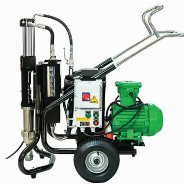
▲ HS-A9 Pro (Silnik iskrobezpieczny)