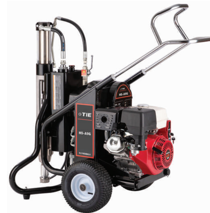
▲ HS-A9G (Silnik Honda GX390)