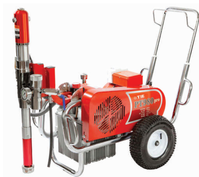
▲ PT 980E (220V)