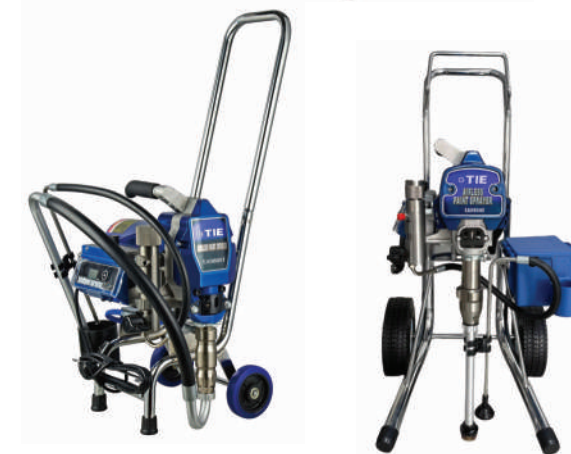
▲ Ręczny Pchany

Wszystkie produkty mogą być personalizowane pod kątem kolorów i logo. Wszystkie modele można dostosować pod kątem konstrukcji ramy oraz napięcia silnika. Rodzaje ram: stojak czteronożny, ręczny pchany, wysoki stojak.