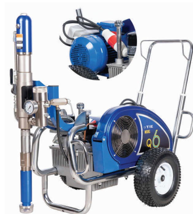
▲ Prado Q6E (380V)