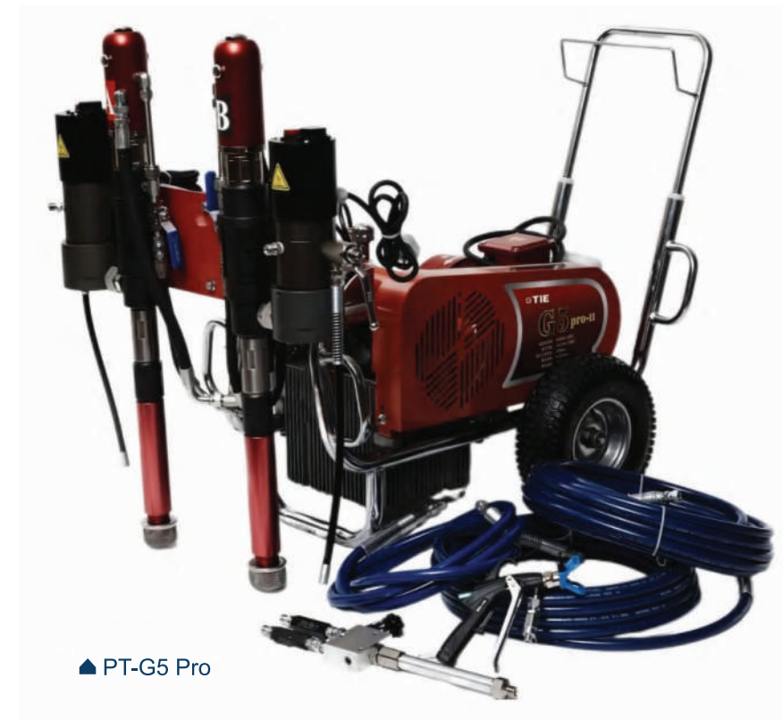
▲ PT-G5 Pro

Przystosowany do pracy w trudnych warunkach. Idealny agregat natryskowy do różnorodnych projektów wodoszczelnych, takich jak izolacja tuneli czy projekty kolejowe.