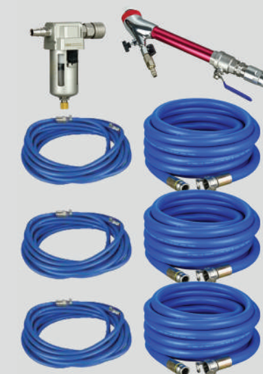
▲ W zestawie bezpłatne akcesoria

Pompy tłokowe generują wysokie ciśnienie robocze, umożliwiają transport materiału przez długie węże oraz wydłużają czas ciągłej pracy na miejscu realizacji, ograniczając konieczność przestawiania urządzenia.