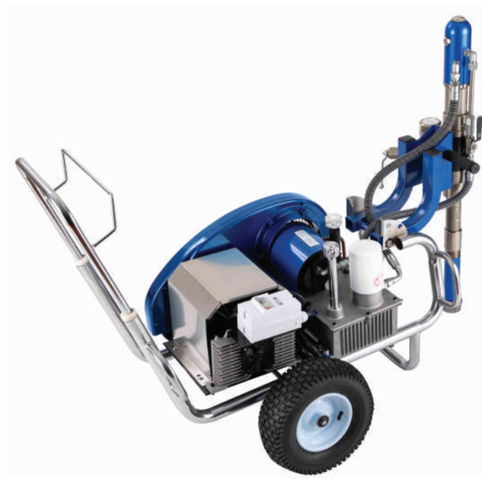
▲ Prado Q6E Pro