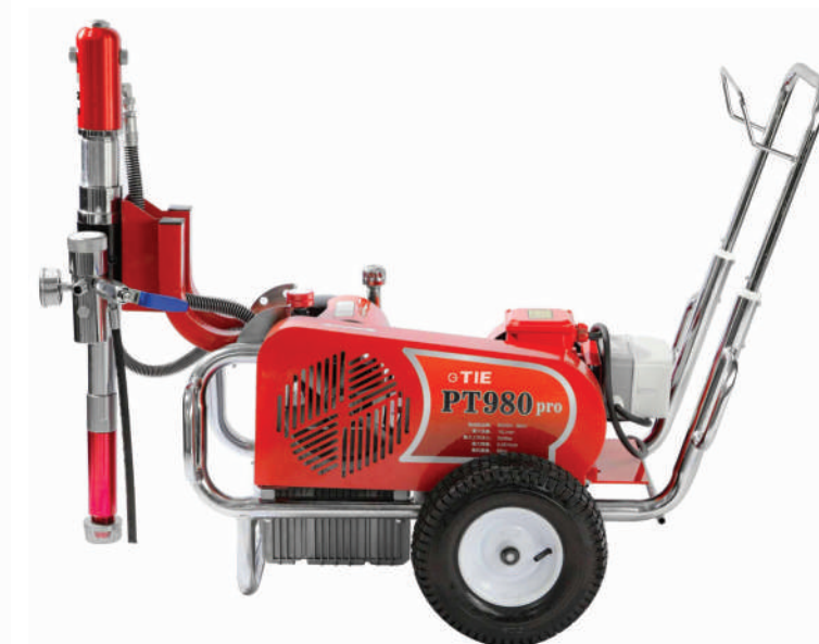
▲ PT 980E (380V)