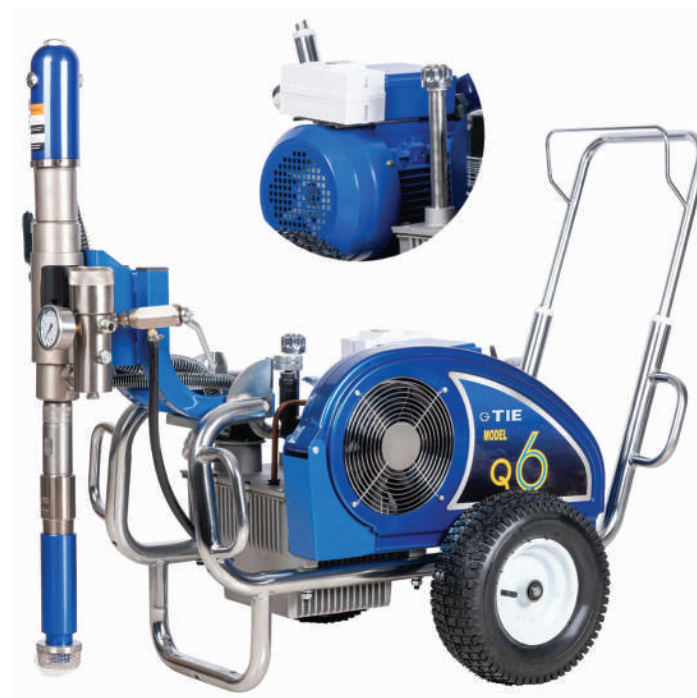
▲ Prado Q6E (220V)