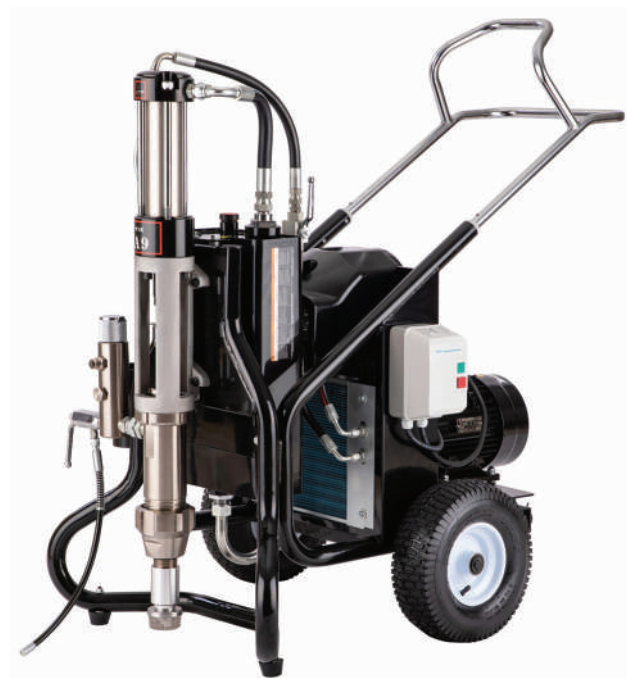
▲ HS-A9E (380V)

Dostępne trzy wersje napędu: elektryczny, silnik benzynowy lub diesel. Seria A9 jest idealna dla użytkowników stosujących farby o wysokim stężeniu, wymagających pracy z wieloma pistoletami natryskowymi lub wykonujących prace na wysokościach.