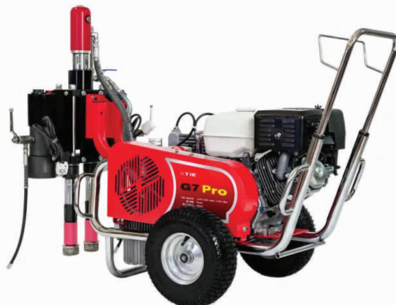
▲ PT-G7 Pro (napęd spalinowy)

Dostępne są zarówno silniki 380 V, jak i silniki spalinowe. Możliwość wyboru napędu w zależności od potrzeb.