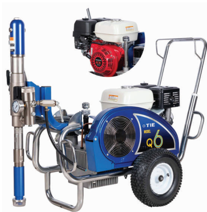
▲ Prado Q6G

Stabilna praca podczas natrysku. Umożliwia aplikację gęstych mas szpachlowych oraz materiałów o wysokiej lepkości (np. farb asfaltowych i szpachli). Dzięki mocnemu silnikowi może współpracować z długimi węzami wysokociśnieniowymi (maks. do 200 m). Urządzenie ma szerokie zastosowanie i spełnia wymagania pracy na placach budowy. Jest doskonałym wyborem do dużych projektów budowlanych oraz natrysku materiałów o wysokiej lepkości.