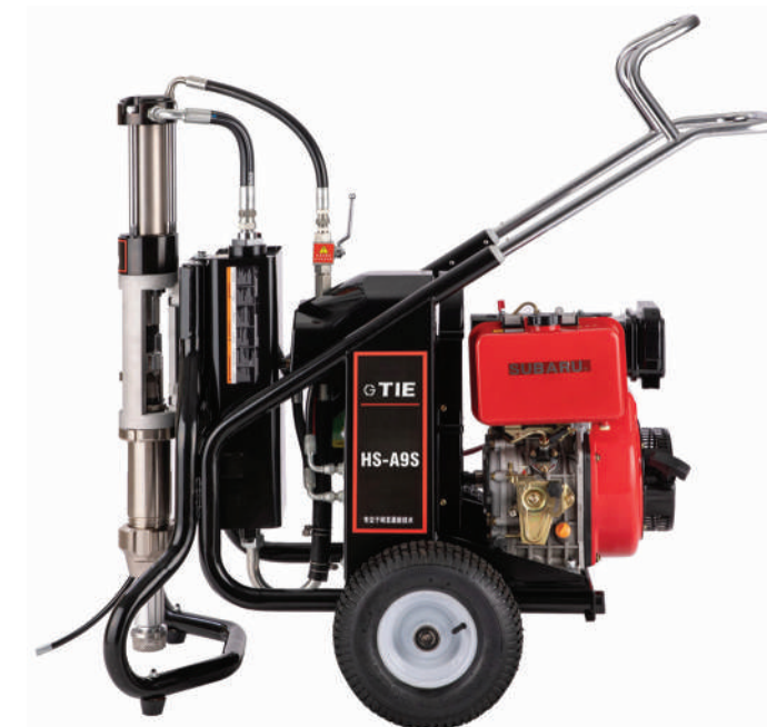
▲ HS-A9S (Diesel Subaru)