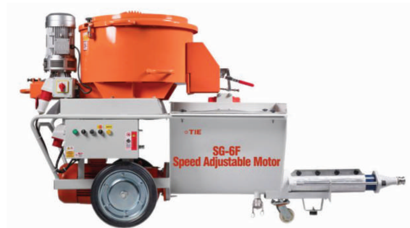
▲ SG-6F (Silnik o regulowanej częstotliwości i zmiennej prędkości)

Wykonany ze zintegrowaną konstrukcją wsporcą, ułatwiającą przemieszczanie urządzenia.