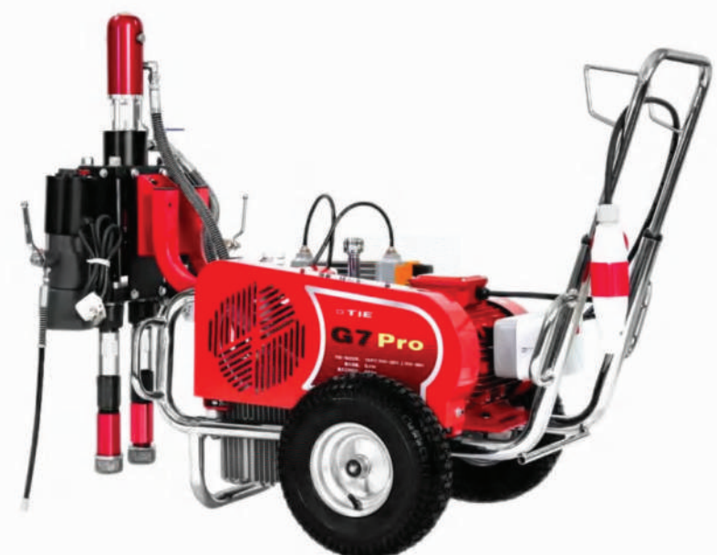
▲ PT-G7 Pro (napęd elektryczny)